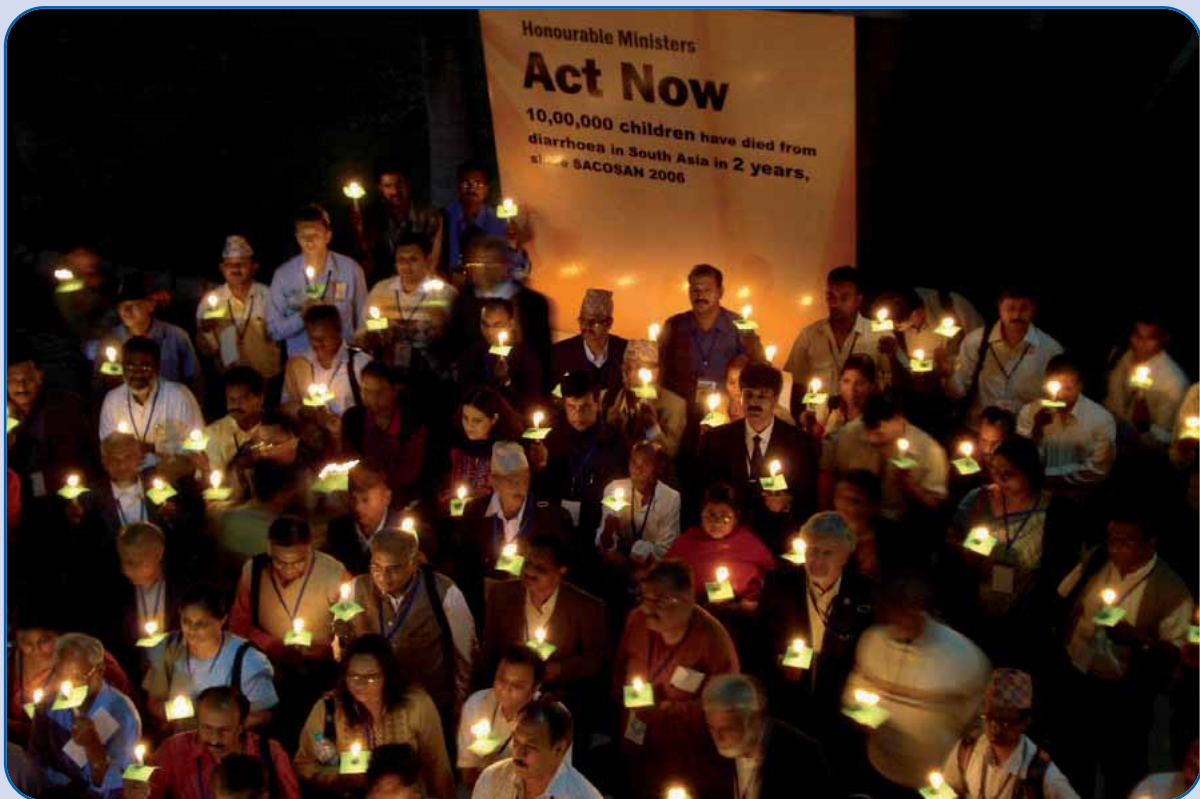
Dirigentes de organizaciones de base en una vigilia silenciosa previa la Conferencia Ministerial de Asia Meridional sobre Saneamiento ((SACOSAN), noviembre del 2008

Para una versión completa del informe y la Hoja de Ruta de los planes de acción de cara a SACOSAN IV, visite: www.fansasia.net